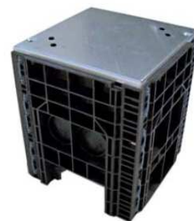
BasicLine | malé