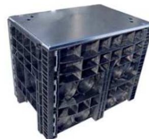
BasicLine | střední