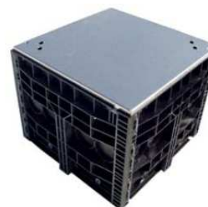
BasicLine | velké