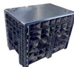
BasicLine | střední